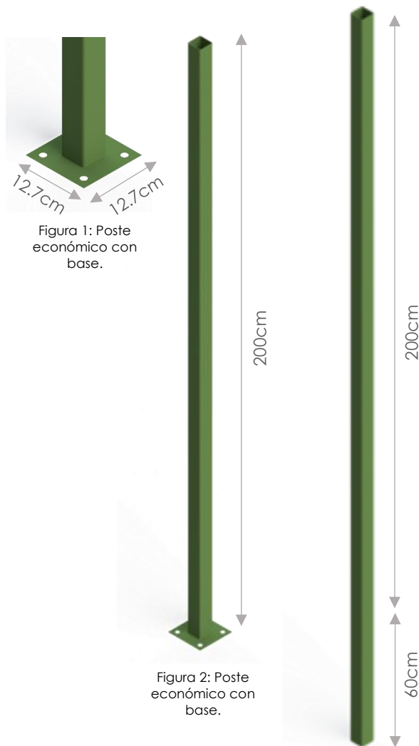
Figura 1: Poste económico con base.